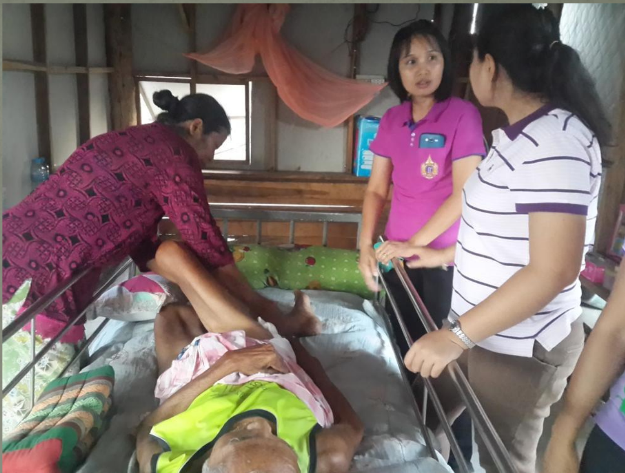
การสอนให้ญาติทำกายภาพให้กับผู้ป่วย